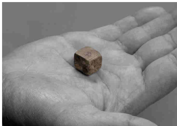
Document, 2016. © Arnaud Vasseux. Design graphique Romain Oudin

Conçue par Arnaud Vasseux comme une seule et même exposition, Du double au singulier sera présentée dans l'espace du Frac à Montpellier et sur le Site archéologique Lattara - musée Henri Prades. Ce projet sera l'occasion pour l'artiste de faire dialoguer des objets de la collection archéologique du musée avec certaines de ses œuvres anciennes et récentes, mais aussi de réaliser des interventions sculpturales à partir d'un choix d'objets antiques issus des réserves. Ainsi, durant tout le mois d'avril, le Frac sera pour lui un « atelier », dont résultera une grande partie du contenu de l'exposition répartie sur les deux sites.