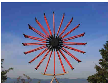
Le Gentil Garçon, Chronique du monde d'avant , 2013 Vidéo Collection Frac Languedoc-Roussillon

associations. Des conférences et des rencontres sont organisés avec les artistes. Au Frac, un vaste programme d'activités, visites, rencontres est proposé au public tout au long de l'année en écho aux expositions.