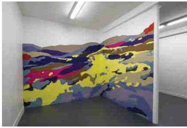
Pablo Garcia, Paysage d'événements , 2015 Peinture murale, acrylique sur mur Collection Frac Languedoc-Roussillon