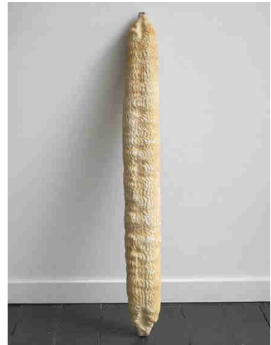
Marqueurs (Pétrification), 2014-2017 Bois, calcaire, 30 éléments, dimensions variables