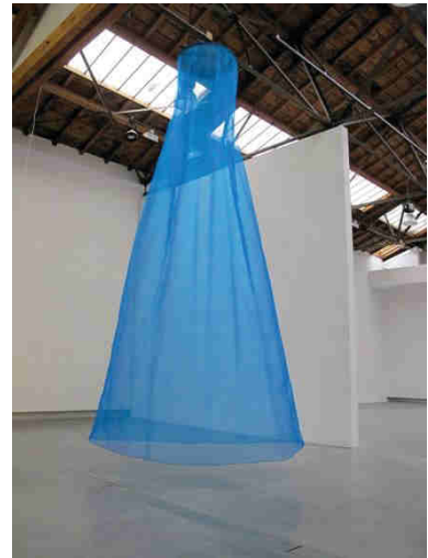
Sans titre, 2010-2017 Filet synthétique, moteur, matériaux divers 450 H x 184 x 184 cm Collection Frac Languedoc-Roussillon