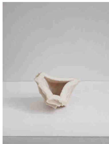
Creux , 2015 Calcaire, 8 x 7 x 5 cm © Arnaud Vasseux

Depuis 2007, le Site archéologique Lattara - musée Henri Prades, Montpellier Méditerranée Métropole soutient et expose la création contemporaine dans une volonté d'ouverture et de transversalité artistique et culturelle. À l'occasion de cette dixième exposition, le musée a invité Arnaud Vasseux à poser son regard singulier sur les objets archéologiques. Dans les espaces mêmes du musée, il fait dialoguer des objets de la collection avec un ensemble d'interventions et de sculptures, principalement réalisées pour l'occasion, in situ . Du double au singulier mêlera ainsi le plâtre et le verre aux matériaux et aux œuvres antiques.